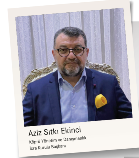
Aziz Sıtkı Ekinci Köprü Yönetim ve Danışmanlık İcra Kurulu Başkanı

etkinliklerimizde her zaman olduğu gibi çok önemli ve özel misafirlerimiz vardı.